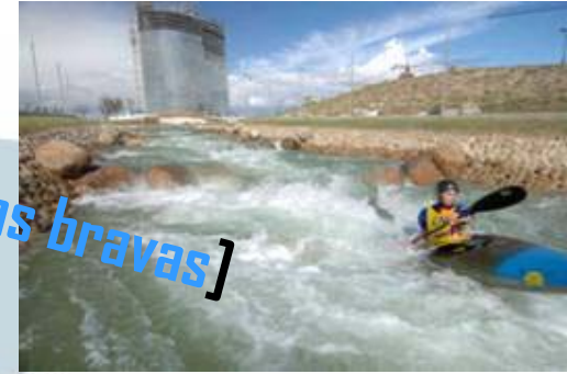
[canal aguas bravas]