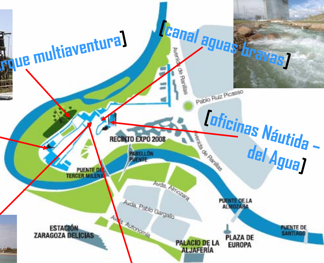
[oficinas Náutica - Torre del Agua]