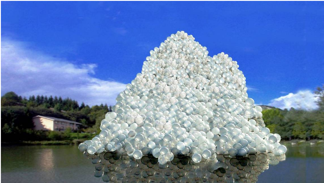
“Atum”, Monique Bastiaans