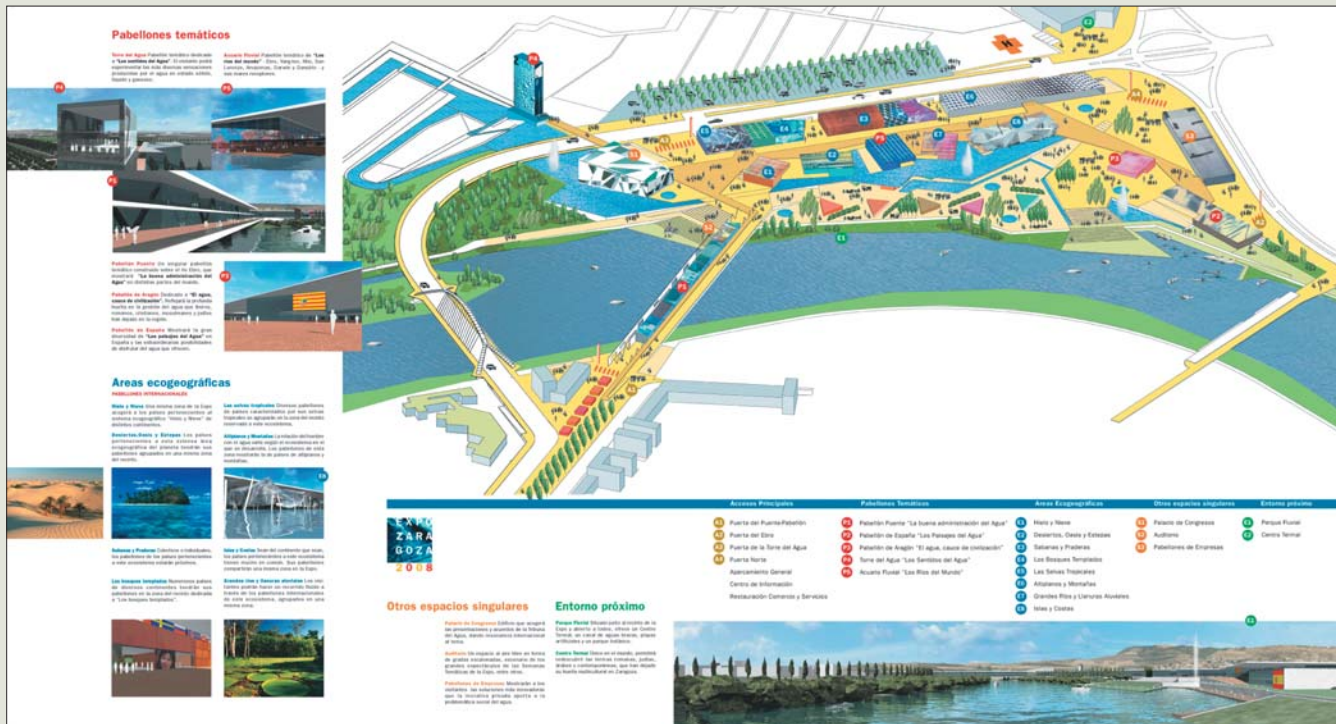
Proyecto de Expo Zaragoza 2008 en el Meandro de Ranillas.

El Consorcio se constituyó en julio del año 2000, fruto de la unión de esfuerzos y economías de las principales instituciones públicas aragonesas: Gobierno de Aragón, Cortes de Aragón, Ayuntamiento de Zaragoza y Diputación Provincial de Zaragoza. La Asociación Cultural que había promovido la iniciativa se sumó mediante un convenio de adhesión. Sin duda, la constitución del Consorcio fue un acto de generosidad política sin precedentes y clave del éxito de la candidatura de Zaragoza.