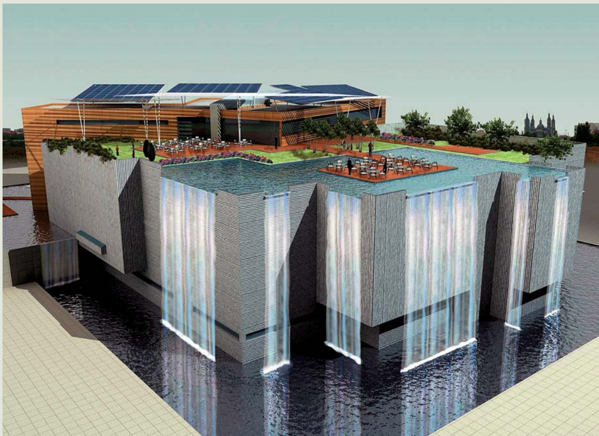
El Acuario Fluvial que se ubicará en el recinto de la Expo será el más grande de Europa y tendrá alrededor de 7.000 ejemplares de 300 especies.

resultante y las condiciones precisas de seguridad. En cualquier caso, las funciones recreativas y paisajísticas de la lámina de agua hacen aconsejable esta intervención.