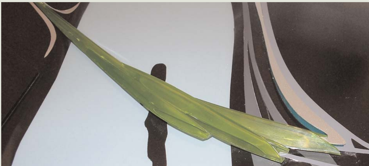
Maqueta del Pabellón Puente de la Expo que construirá la prestigiosa arquitecta iraquí Zaha Hadid.

sentación de la flora de la Tierra ordenada en función de su relación con el agua, espacios deportivos y de ocio para el disfrute del agua –canal de aguas bravas, playas fluviales, canales de remo y centro termal–, así como espacios museísticos al aire libre con exhibición de piezas del patrimonio arqueológico hidráulico, instalaciones artísticas contemporáneas y artefactos hidráulicos que, más tarde, formarán parte del Museo de la Ciencia y el Agua.