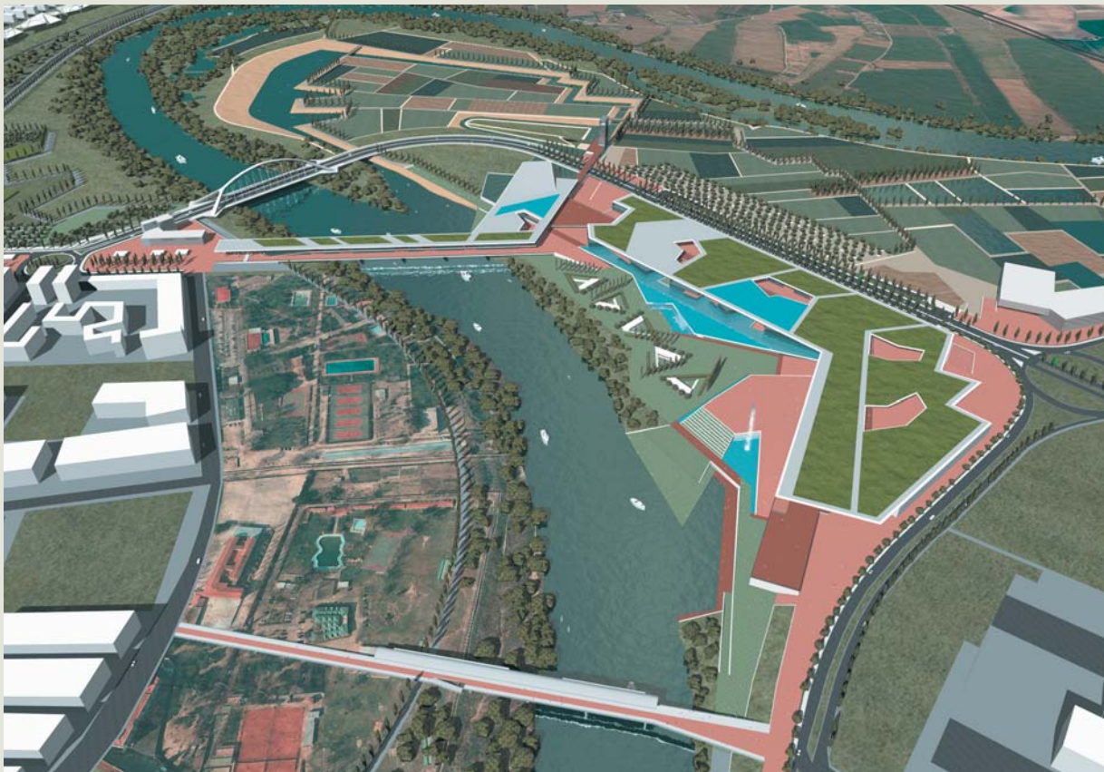
Recreación virtual del Meandro de Ranillas, escenario principal de la Expo Zaragoza 2008.

Para respaldar esta exposición se cuenta con sólidos principios y motivos de orden internacional, nacional, regional y local. Destacan el grado de desarrollo y de