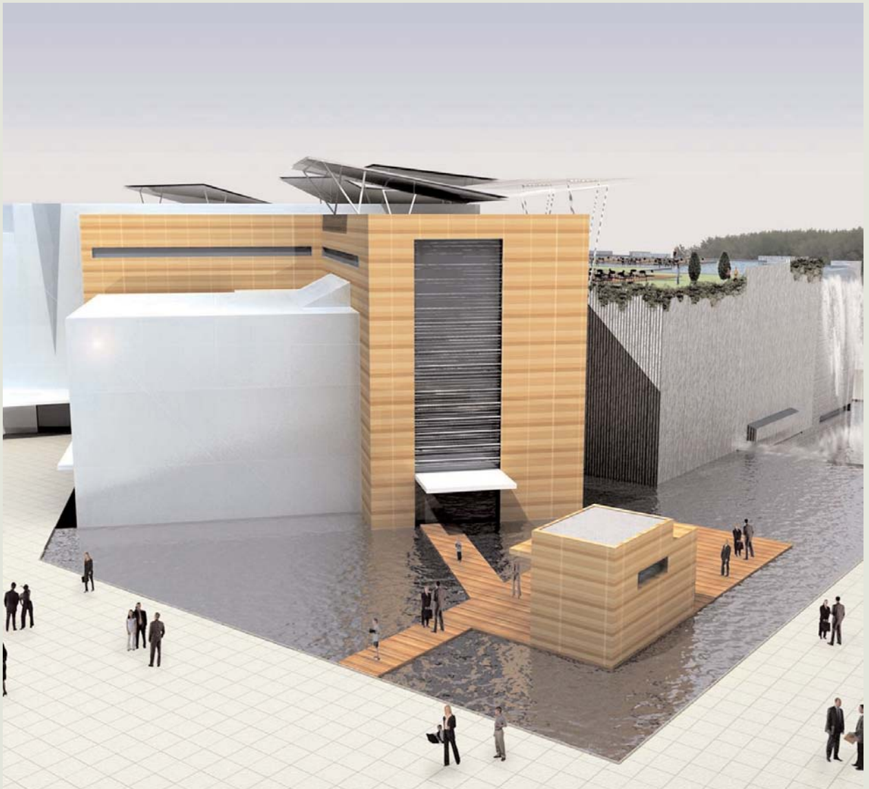
Recreación virtual del Acuario Fluvial que construirá la empresa francesa Coutant Aquarium en el Meandro de Ranillas.