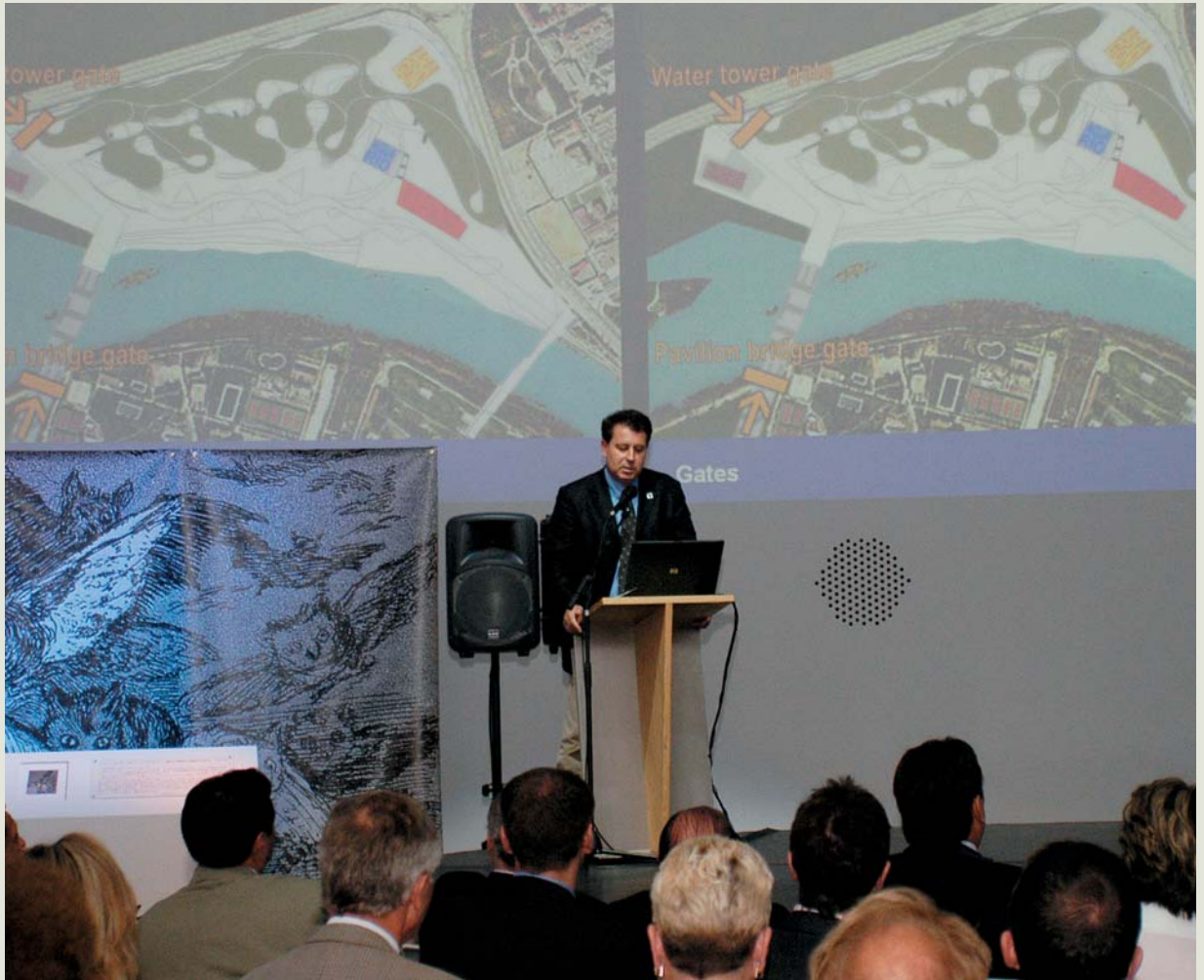
Zaragoza Expo 2008 presentó en Aichi 2005 su proyecto y los países participantes en Japón recibieron el mensaje de la invitación a Zaragoza.

habitantes de convertirse en modelo de utilización sostenible de los recursos empleados para su celebración: