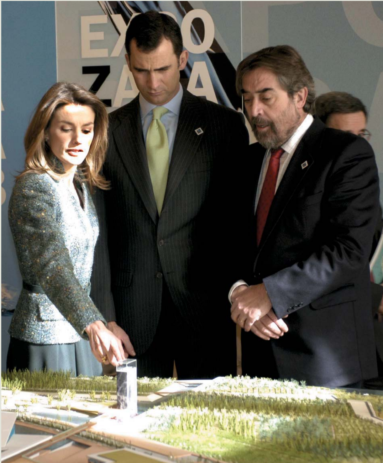
El proyecto de Zaragoza Expo 2008 ha conseguido ilusionar a toda la sociedad y ha contado con el apoyo de todos los colectivos e instituciones, especialmente con el de la Casa Real a través de la visita que realizaron los Príncipes de Asturias.